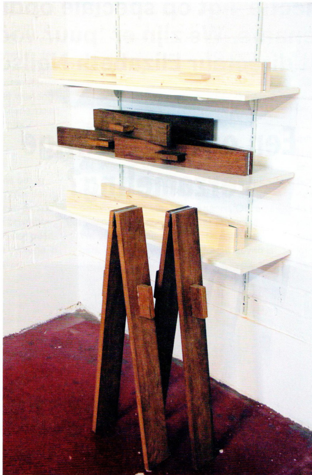
Stefaan Dheedene, Slapstick (studio view) , 2016, vurenhout en merbauhout, variabel in lengte

werd veel gebruik gemaakt van slapstick, een simpel instrument van twee planken met een scharnier dat je dichtklapt om grappige of gewelddadige scènes extra kracht bij te zetten. Het eerste special effect, eigenlijk. Ik maak de slapsticks in allerlei formaten en houtsoorten, en wil met een stel muzikanten een heel orkest vormen.' Herhaling, een terugkerend thema bij de kunstenaar, wordt op deze wijze niet enkel illustratief uitgedrukt, maar krijgt ook een auditieve dimensie.